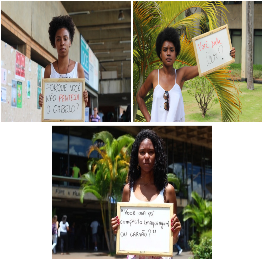
Fotos: Ensaio fotográfico do Blog “AquilombandoDFE” em campanha articulada por alunos da UnB.

para a educação, estudantes da UnB (primeira universidade brasileira a aderir ao sistema de cotas) desenvolveram o projeto “Negro na mídia”, onde buscam dar visibilidade aos jovens negros estudantes que desejem relatar suas experiências. Uma das campanhas do projeto se trata de um ensaio fotográfico que mostra um conjunto de frases e comentários que reforçam estereótipos negativos atribuídos aos jovens negros apresentando assim ações do racismo velado/institucionalizado em detrimento da conscientização da população visando evitar que essas situações reiteradas continuem a acontecer.: