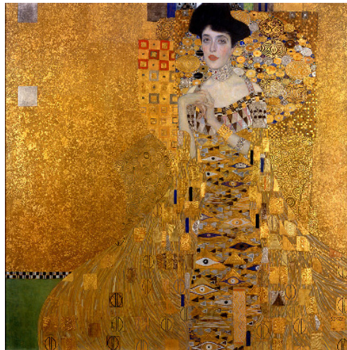
Figura 1 - Retrato de Adele Bloch-Bauer I